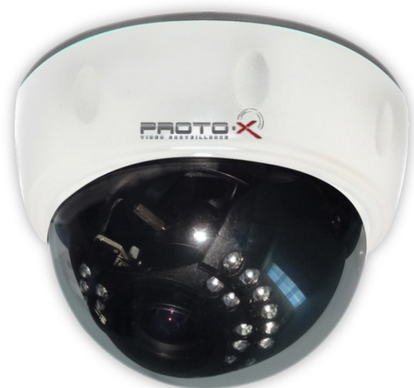
Купольная видекамера с ИК подсветкой