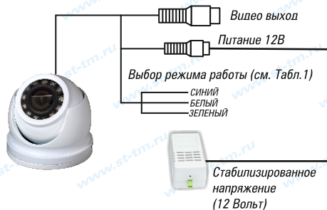
Рис.1 Схема подключения